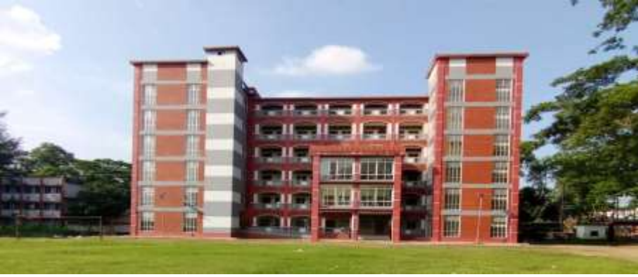
নতুন বিজ্ঞান ভবন