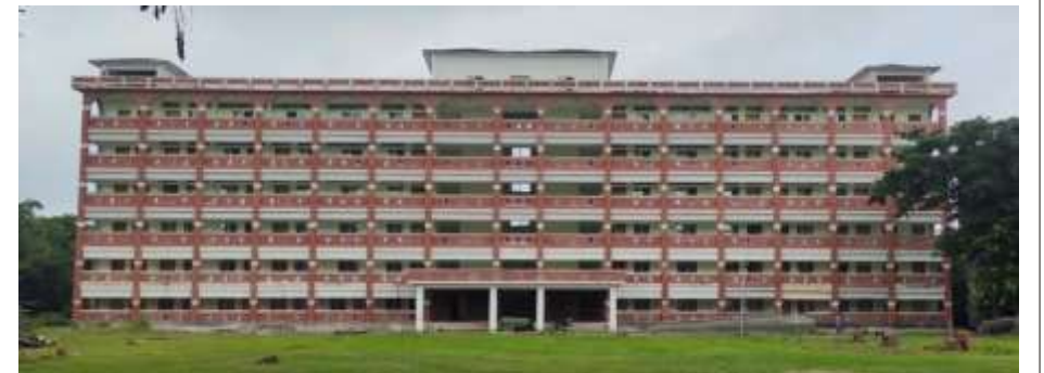
নবনির্মিত আলীগড় একাডেমিক ভবন