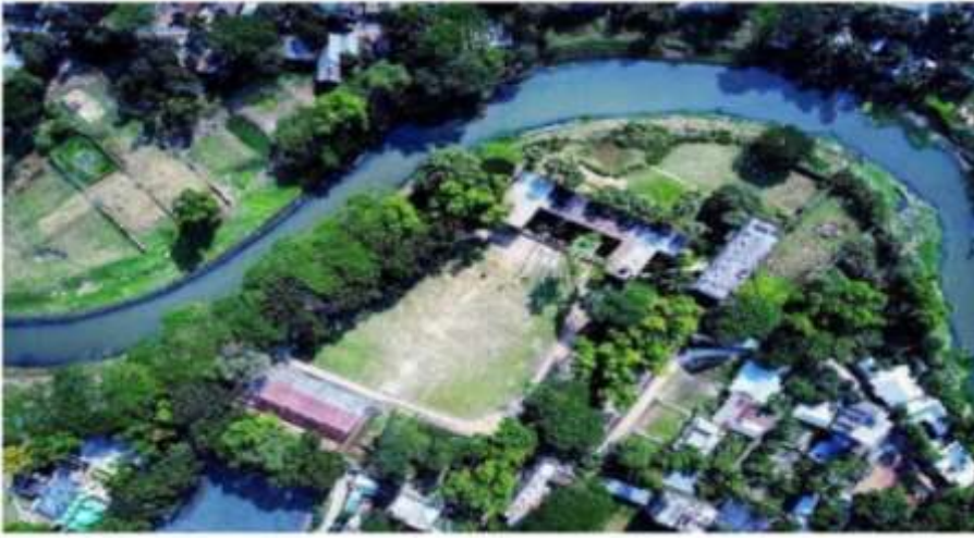
পাখির চোখে নওয়াব ফয়জুল্লাহ সরকারি কলেজ